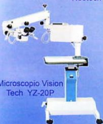
Microscopio Vision Tech YZ-20P