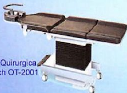
Mesa Quirúrgica Neotech OT-2001