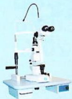
Lámpara de hendidura Zeiss SL-1800