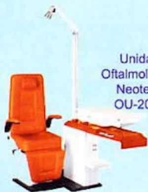
Unidad Oftalmológica Neotech OU-2000