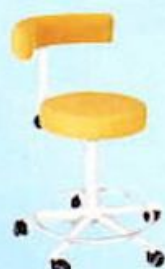
Silla Neotech DS-2000